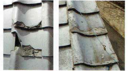
瓦が著しく破損している例